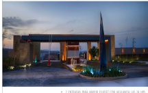
• 2 ENTRADAS PARA MAYOR FLUIDEZ CON VIGILANCIA LAS 24 HRS.