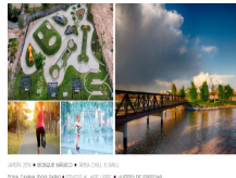
GRUPO DE SPA • PISCINA INFANTIL • SPA FULLY EQUIPADO • ZONA CANTINA DONDE PARECE AL VIEJO SAN LUIS • ALBERGUE DE OPOSUM