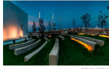
• 1000 BALSAS DE PÉLULA