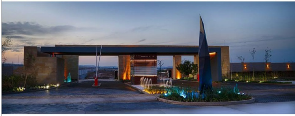
• 2 ENTRADAS PARA MAYOR FLUIDEZ CON VIGILANCIA LAS 24 HRS.

Clave: TV1902002PV Precio: $ 2,190,320 Terreno: 230.52 m 2 Uso de suelo: Habitacional A partir de: Dic 2020 Ciudad: San Luis Potosí Colonia: Alto Lago